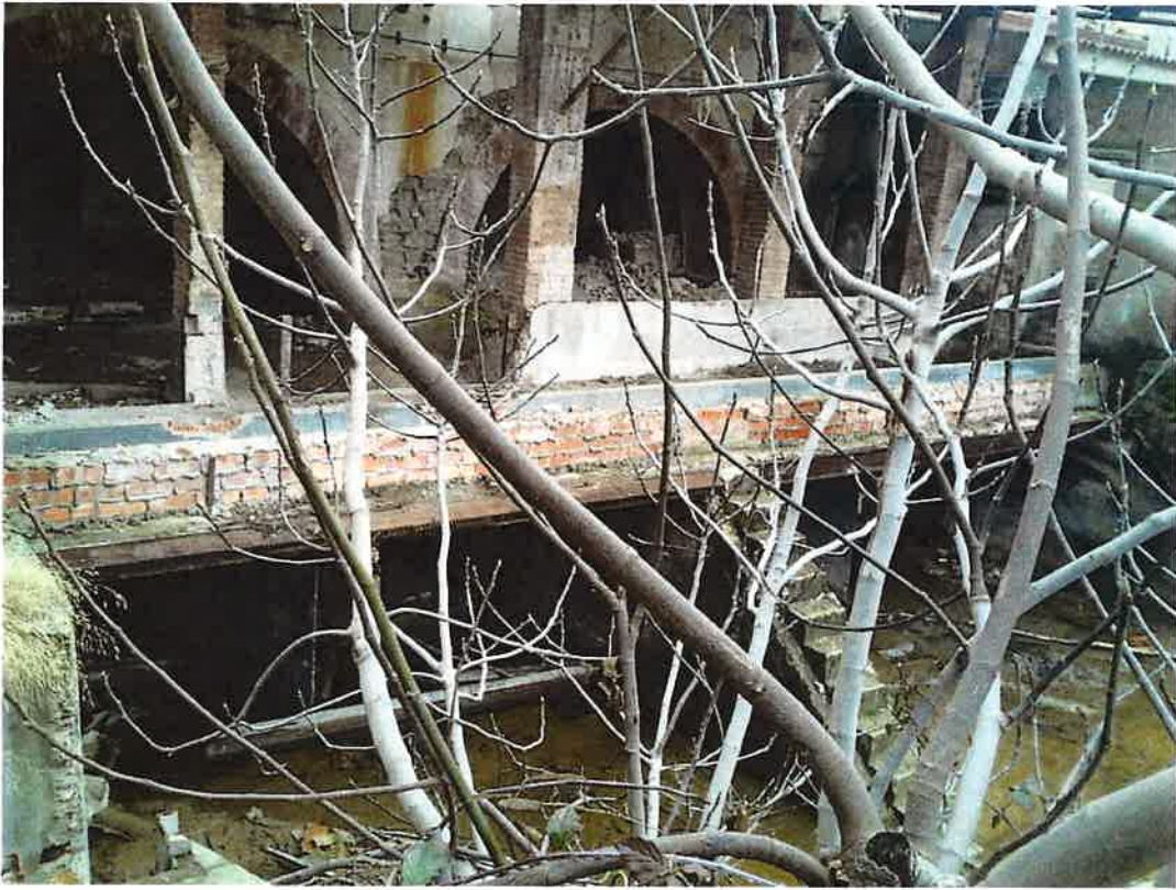
Buits comportes, filtres i reixes d'entrada càmeres d'aigua