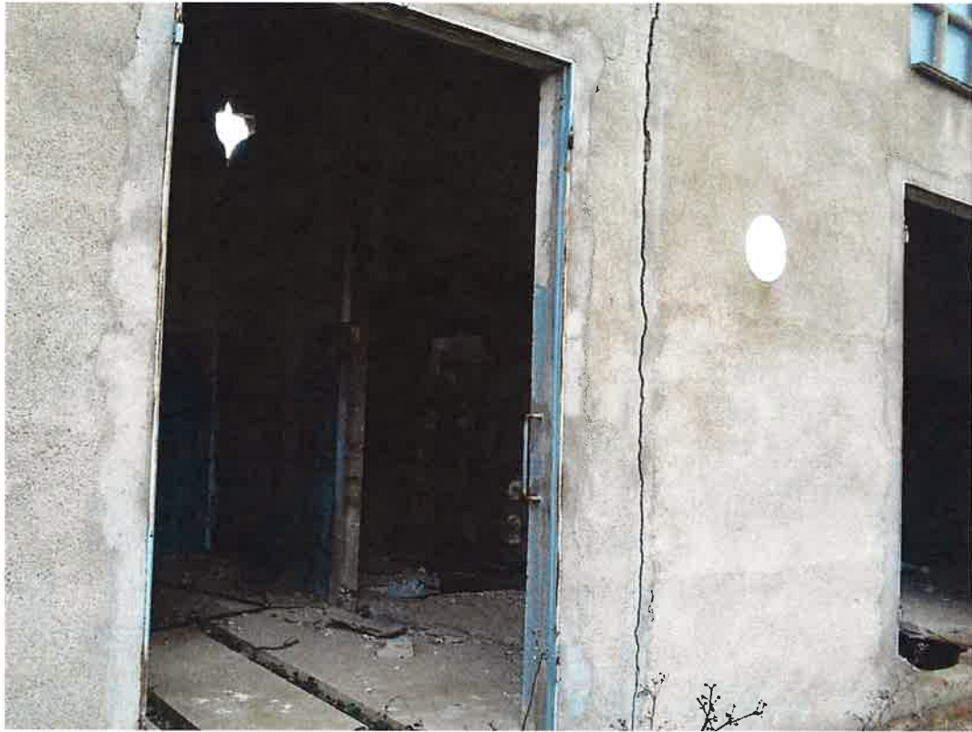
Interior Centre de Transformació