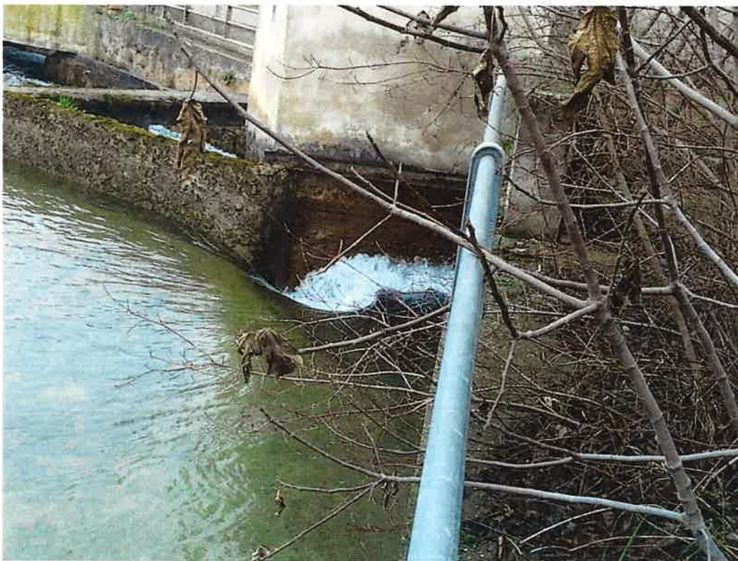
Comportes derivació i laterals