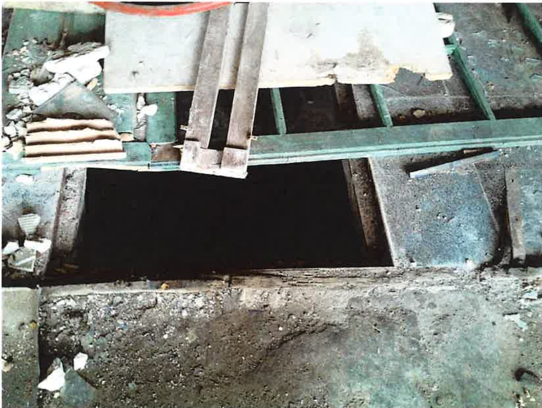
Entrada alternador eix vertical