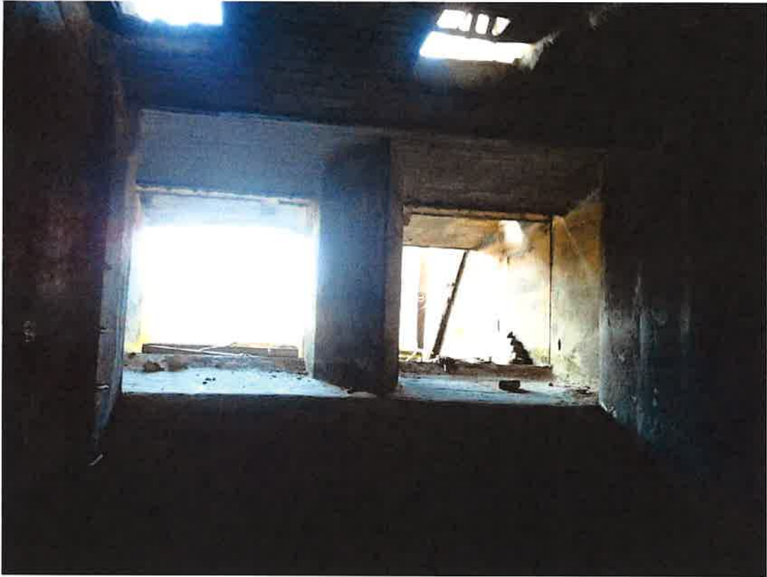
Part interior càmera d'aigua