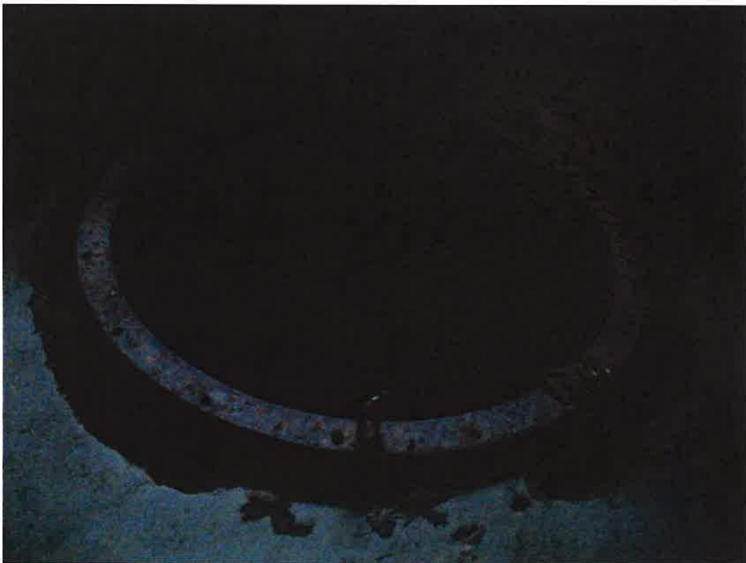
Forat 2 turbina eix vertical tipus Kaplan