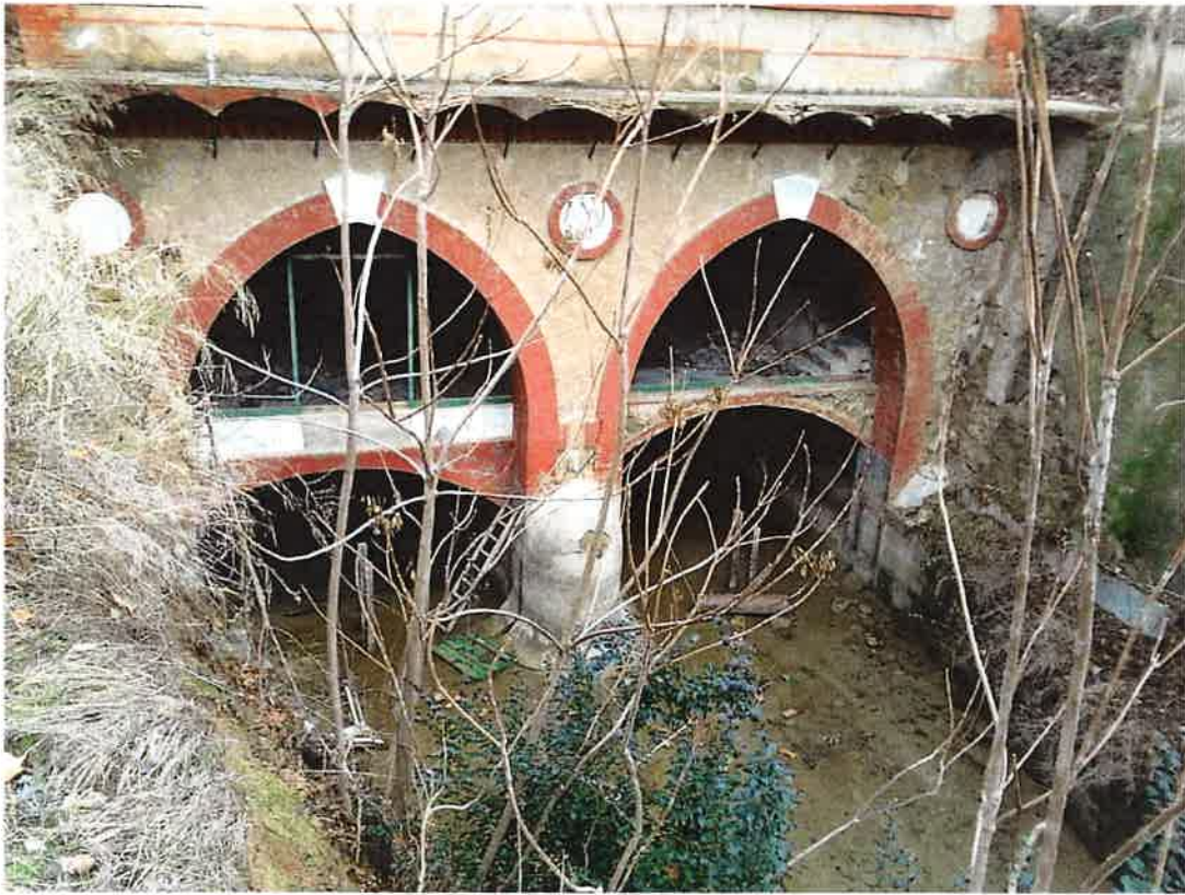
Sortida aigua turbinada, part posterior edifici