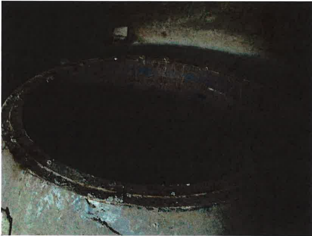
Forat 1 turbina eix vertical tipus Kaplan