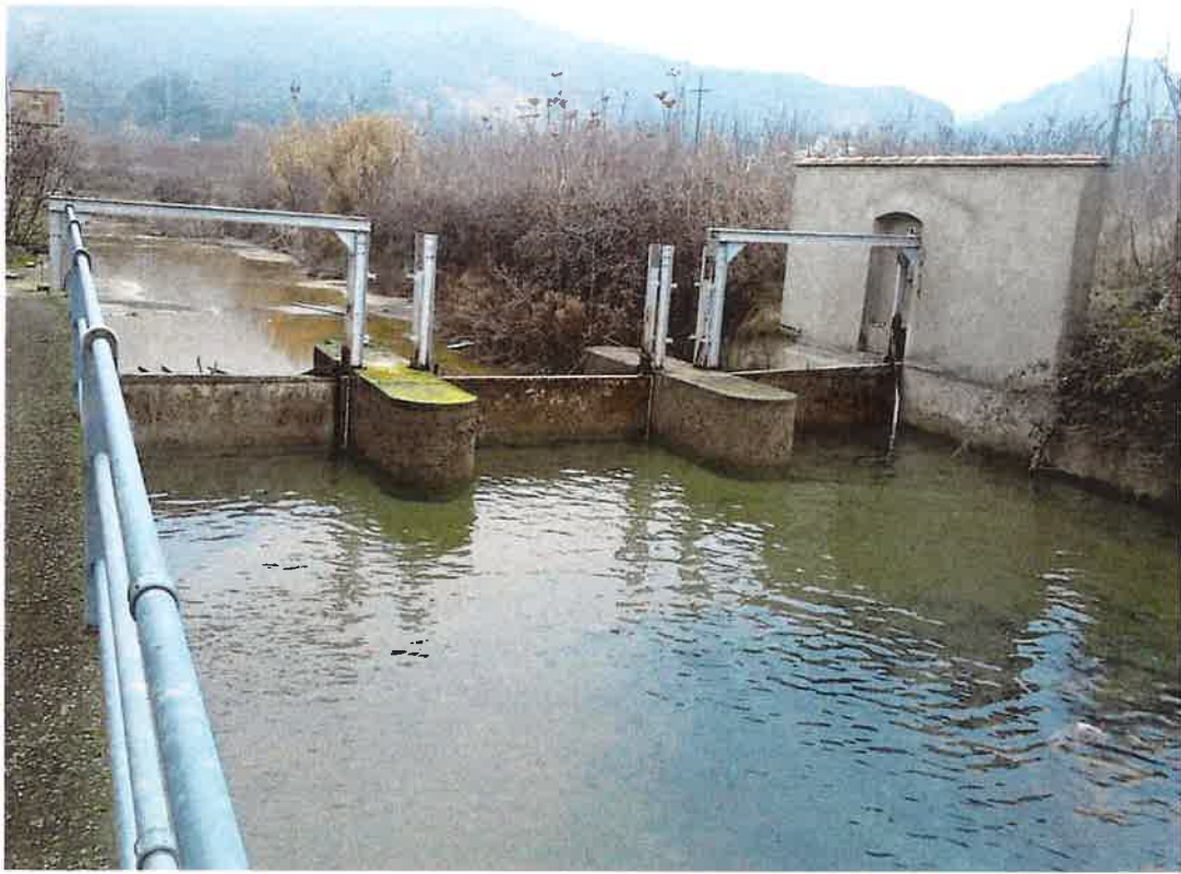
Comportes entrada canal de derivació