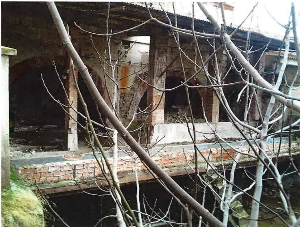
Edifici de Contenció