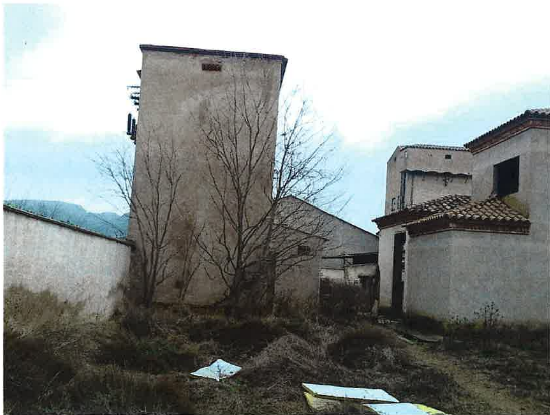
Exterior Centre Transformació