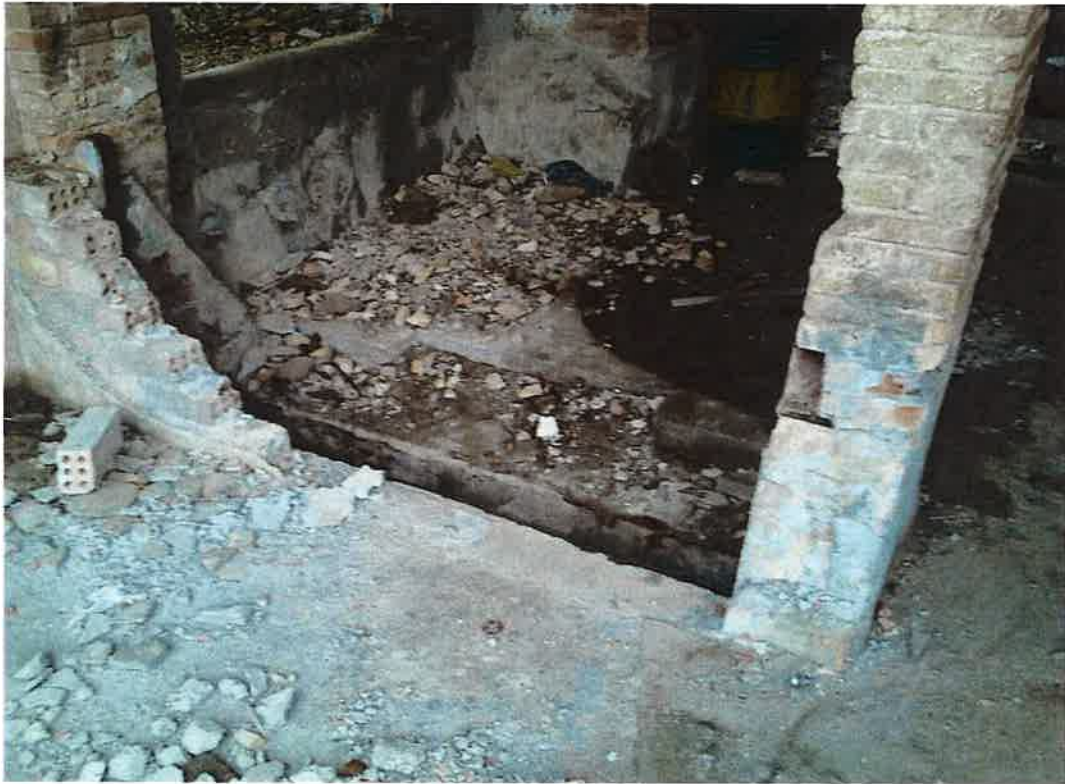
Buit comporta entrada càmera d'aigua