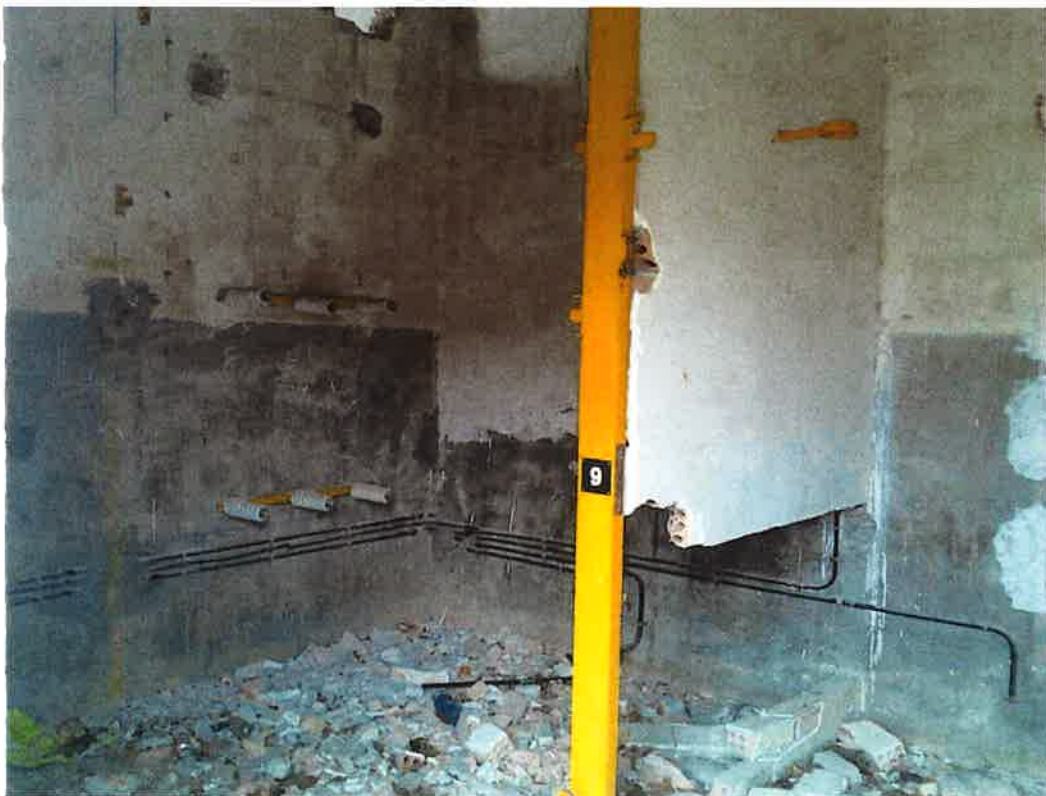
Interior Centre de Transformació