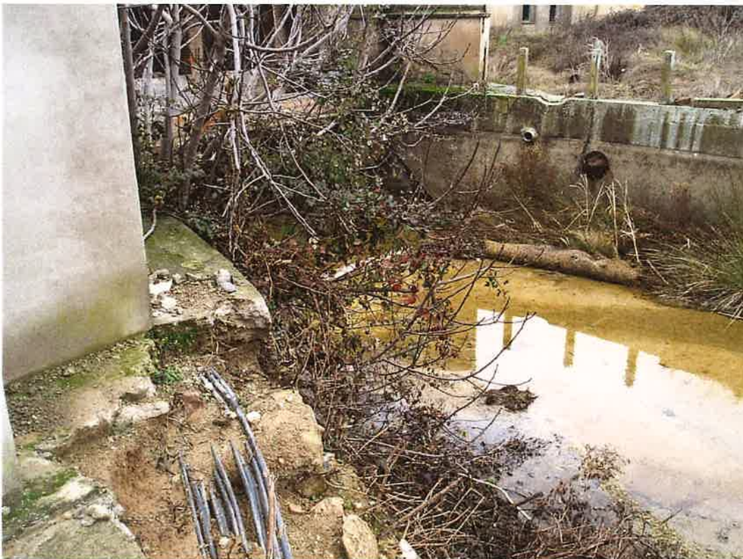
Corba canal d'entrada turbines