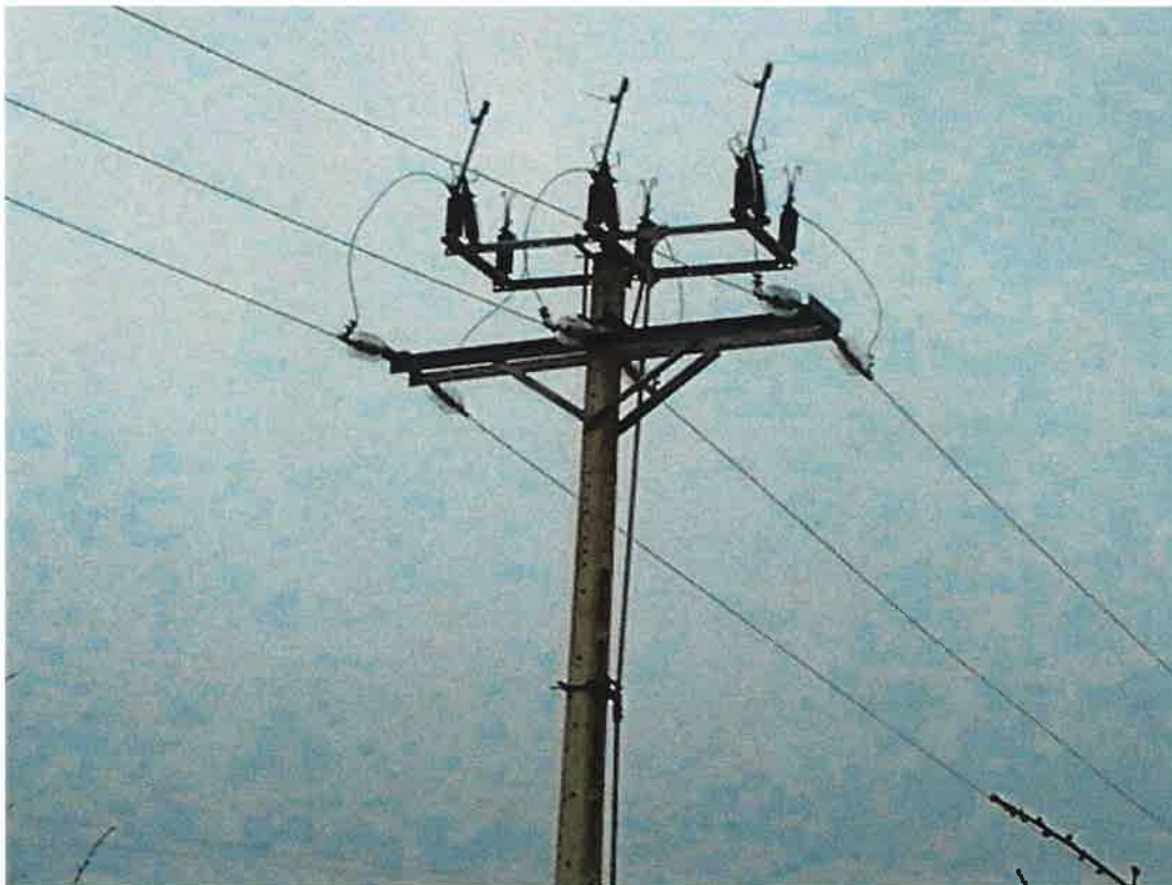
Seccionador Companyia Endesa Distribución Eléctrica, SL