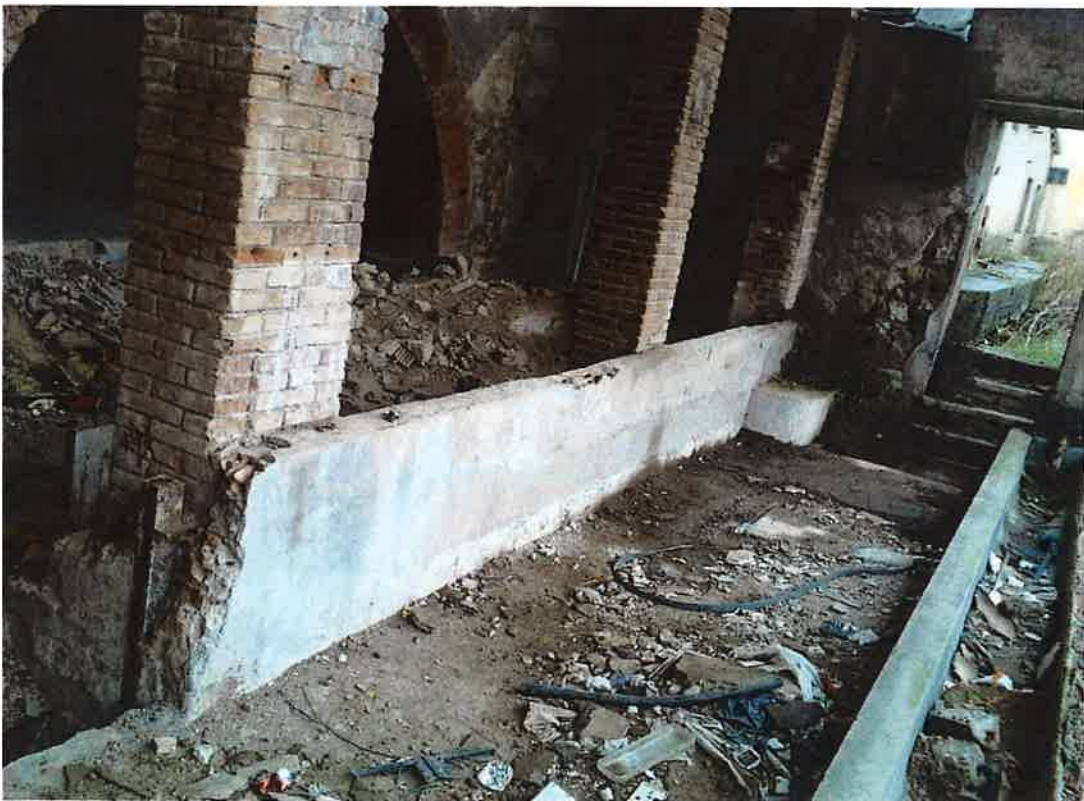
Part superior edifici turbines