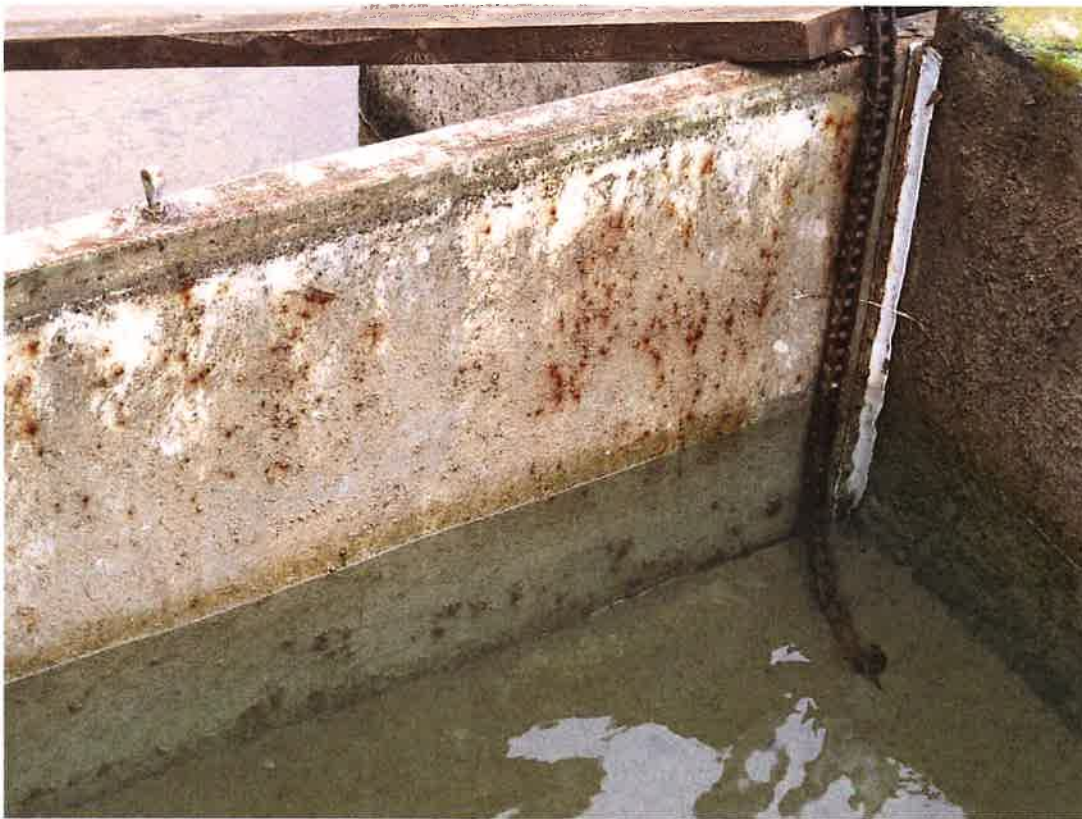
Comporta entrada canal