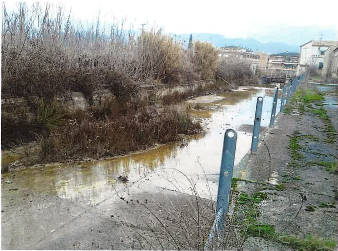
Recta Canal de derivació