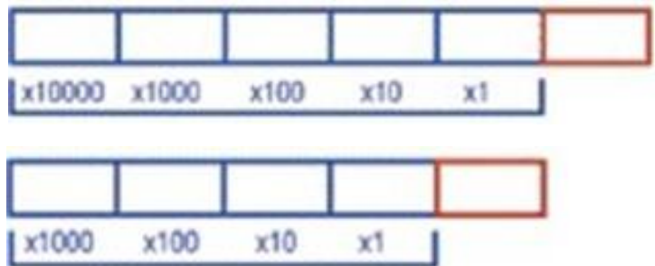
FOTO DEL COMPTADOR

Anoteu sols els números en blau o negre del comptador, són els m 3 (els números després de la coma, en roig, no es tenen en compte)