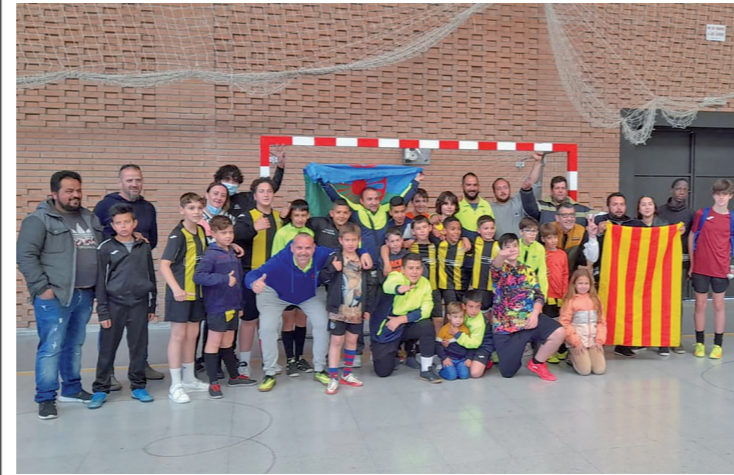
Futbol Sala Alfarràs, Campions de la Lliga Escolar del Segrià 2021/22