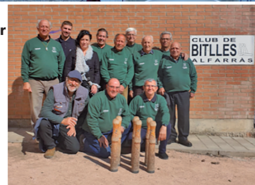
Club Bitlles Alfarràs, Campions del grup B de Bitlles de Lleure de Lleida